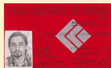
Domicilio en la ciudad