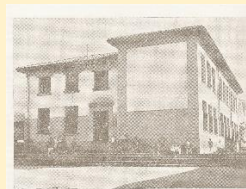
Las instituciones de formación

... No recuerdo que en la escuela hiciéramos alguna vez algo que no fuera lo que se esperaba. Ninguna novedad. Nunca... (p. 37)