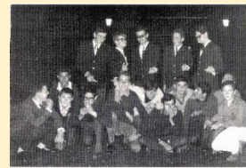
El grupo de amigos

... A mediados de la década de los años sesenta la fuerza del cambio cultural era tan grande que se dejaba sentir en pueblos como Arriendas... (p. 38)