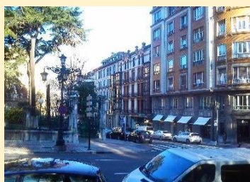
Los pisos de estudiantes

... Este paso por los pisos de estudiantes estuvo en el origen de las otras transiciones que hice con mi vida por aquel entonces: la de las creencias, la de la política y la del conocimiento, que tanto iban a determinar mi manera de enseñar y de pensar la profesión... (p. 42)