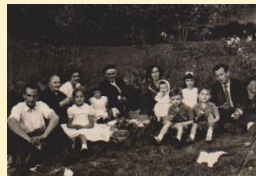
El medio familiar

Mis padres [...] trajeron consigo a la familia que formaron en 1946 muchos de los rasgos característicos de la cultura tradicional, aunque ya no pudieron transmitirlos tal cual ... (p. 35)