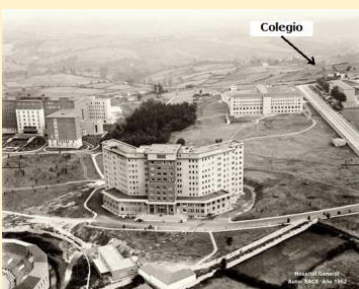
Mientras estuve interno

... Mi presencia en la ciudad se redujo durante esta primera etapa al internado en el colegio, a las clases en la Escuela Normal y a los desplazamientos entre ambos lugares... (p. 40)